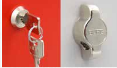
BURG | Silindir Kilit Sistemleri