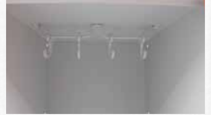
NHTD Model Dolaplarda Plastik Askılı Kanca