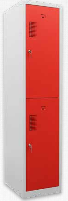
Q NHT-20 170