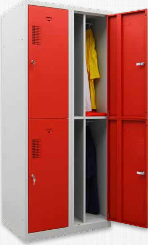
Q NHTD-20 190