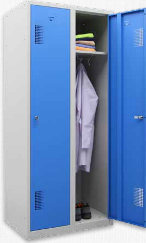
Q NHT-20 175