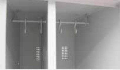
NHTD Temiz Ve Kirli Çamaşırlar İçin Dolap Bölmesi