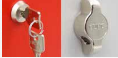
BURG | Silindir Kilit Sistemleri