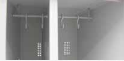
RHTD Temiz ve Kirli Çamaşırlar İçin Dolap Bölmesi