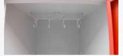
RHT Model Dolaplarda Plastik Askılı Kanca