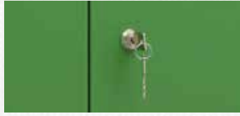
BURG | Silindir Kilit Sistemleri