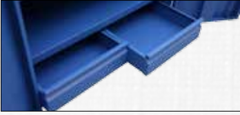
Dolap İçerisinde Opsiyonel Çekmece