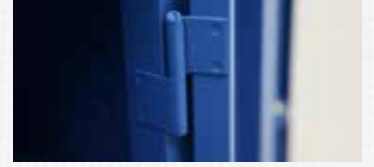
180° Açılabilir Metal Mentşeli Kapılar