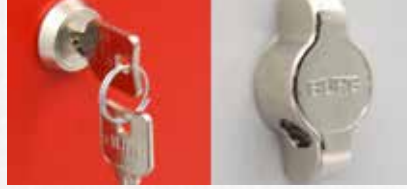
Silindir ve Asma Kilit Seçenekleri