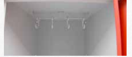
PHT Model Dolaplarda Plastik Askılı Kanca