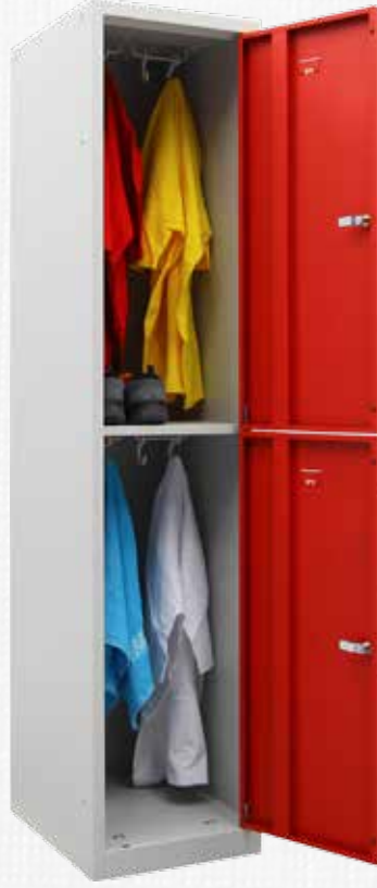
🔍 PHT-20 074