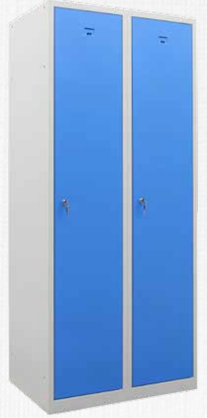
🔍 PHT-20 079