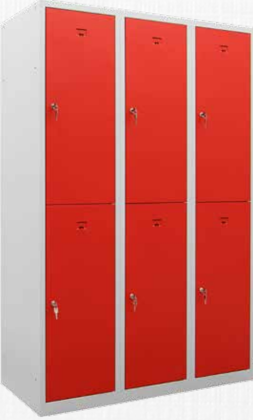
🔍 PHT-20 086