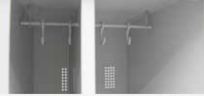
PHTD Temiz ve Kirli Çamaşırlar İçin Dolap Bölmesi