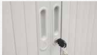
Çift Anahtarlı Silindir Kilit