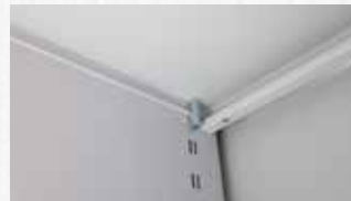
21 mm Hatve Mesafeli Raf Tırnakları