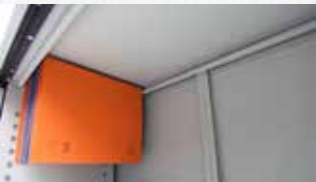
Şapka Altında Asma Dosya Sistemli