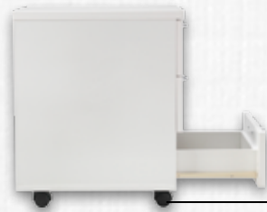
3 Çekmeceli Mobil Keson