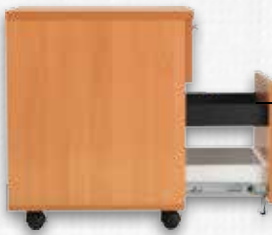
2 Çekmeceli Mobil Keson