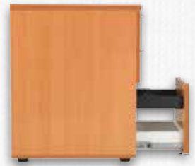
Lateral Askı Dosyalar İçin Asma Ünitesi